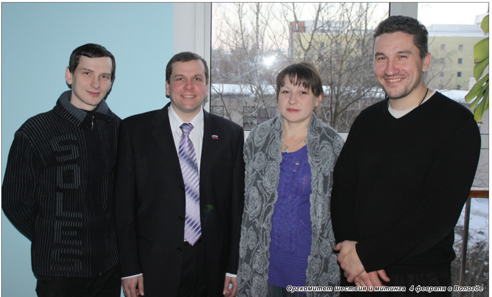
Оргкомитет шествия и митинга 4 февраля в Вологде